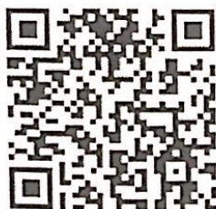
สมัครสมาชิก ส.บ.ม.ท.