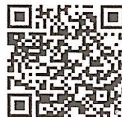
ตรวจสอบรหัสสมาชิก ส.บ.ม.ท.